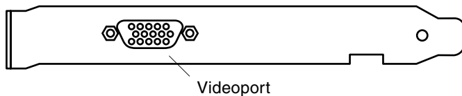
FIGUR 1-2 Bakplatta på Sun PGX64

FIGUR 1-2 visar bakplattan på grafikkortet Sun PGX64 och videoporten HD15.